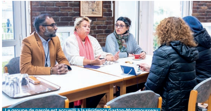
Le groupe de parole est accueilli à la résidence Gaston-Monmousseau.

Une fois par mois, une psychologue leur permettra de rompre cette solitude, d'être entendu, de partager avec d'autres leurs expériences. Mais aussi de connaître leurs droits. Depuis 2022, ceux-ci