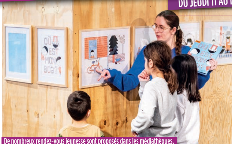
De nombreux rendez-vous jeunesse sont proposés dans les médiathèques.

PLACE RABIN-ARAFAT. DÉMONSTRATIONS ★ Découvrez le cricket 10 h-12 h. Gratuit.