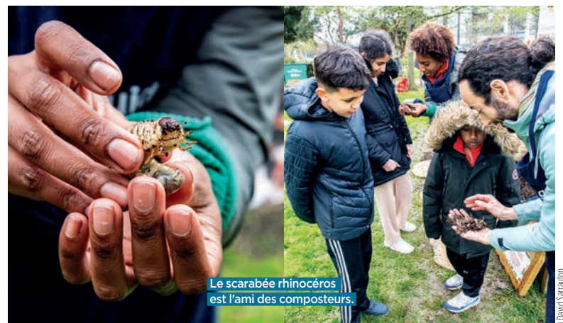
Le scarabée rhinocéros est l'ami des composteurs.