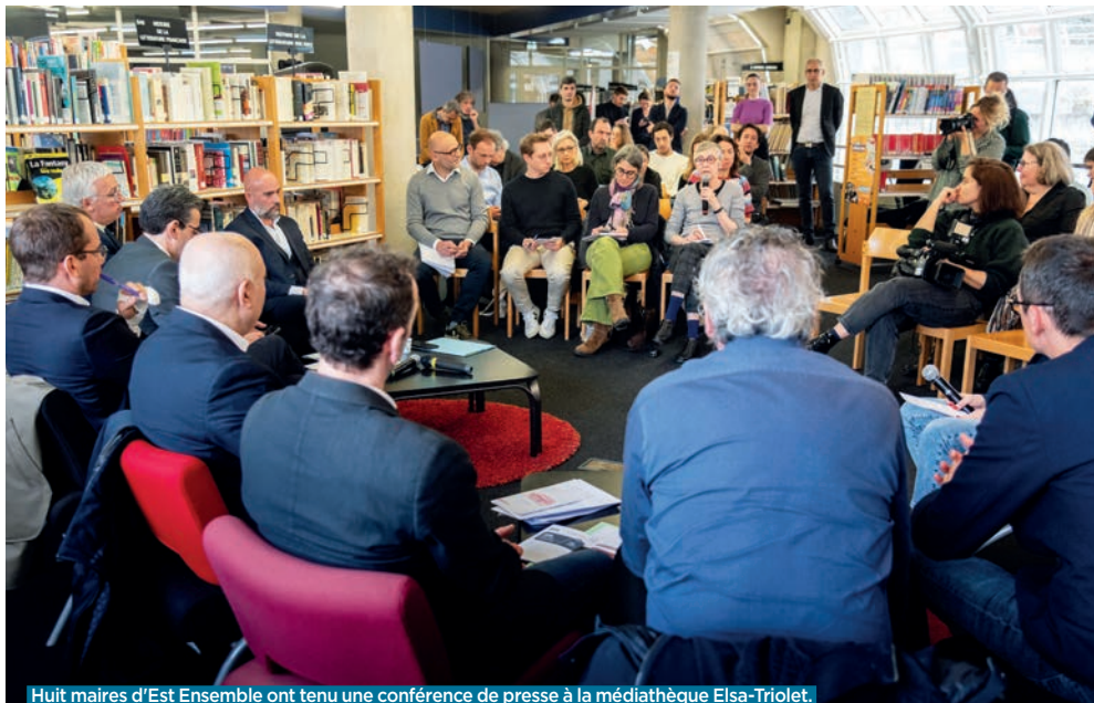
Huit maires d'Est Ensemble ont tenu une conférence de presse à la médiathèque Elsa-Triolet.

Dans un rapport qui dénonce de nombreuses inégalités , publié le 27 mars dernier, huit maires d'Est Ensemble déplorent le sous-investissement de l'État sur leur territoire.