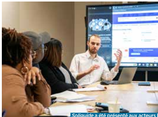
Soliguide a été présenté aux acteurs balbyniens de la solidarité.

Un guide de la solidarité vient d'être mis en ligne à Bobigny pour orienter les personnes en difficulté et pour trouver facilement de l'aide. Une plateforme en test pendant 18 mois.