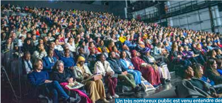
Un très nombreux public est venu entendre des intervenant-es du monde entier.

Au lendemain de la Journée internationale de lutte contre les violences faites aux femmes, l'Observatoire départemental a listé les dispositifs opérants dans le 93 et souligné l'urgence d'une campagne nationale.