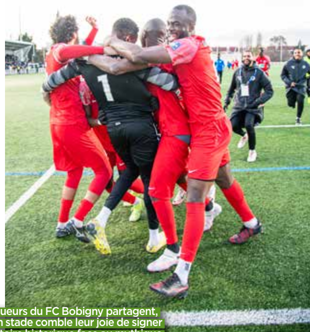
Les joueurs du FC Bobigny partagent, dans un stade comble leur joie de signer une victoire historique face au mythique Red Star au terme d'un match crispant.