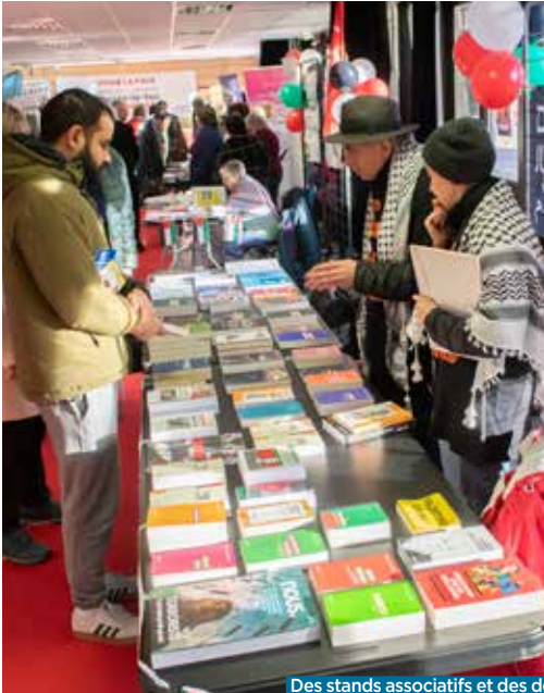
Des stands associatifs et des débats lors de cette journée palestinienne.

À l'occasion de la journée internationale de solidarité avec le peuple palestinien, un forum s'est tenu le vendredi 29 novembre à la salle Pablo-Neruda .