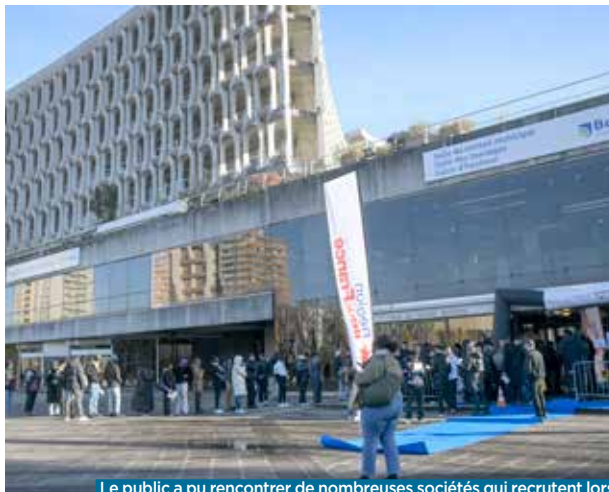
Le public a pu rencontrer de nombreuses sociétés qui recrutent lors de cette journée organisée à l'Hôtel de ville.

Le conseil régional organisait le 28 novembre dernier, en partenariat avec la Ville, une grande opération de job dating dans le salon d'honneur de l'Hôtel de ville. Plus de cinq cents candidat-es s'y sont présentés-es.