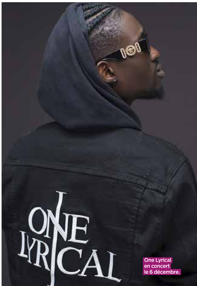
One Lyrical en concert le 6 décembre.

Ils seront pour la première fois en concert en France : One Lyrical, Taal Bi et Samarino, des artistes qui font déjà le buzz dans leur pays.