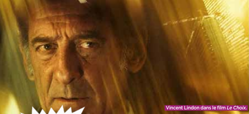
Vincent Lindon dans le film Le Choix .