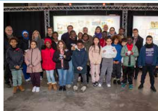
Des élèves des écoles Marie-Curie et Romain-Rolland récompensés.

EN MARS DERNIER , des élèves balbyniens ont rendu hommage aux enfants juifs déportés entre l'été 1943 et l'été 1944 depuis l'ancienne gare de Bobigny. Une mémoire activée avec la lecture des noms des 3 285 enfants déportés diffusée pendant une semaine au Mémorial balbynien et la tenue d'une cérémonie d'hommage le 22 mars. L'aboutissement d'un projet de « transmission mémorielle et citoyenne » mené avec l'Éducation nationale et l'Office national des combattants et des victimes de guerre auprès de 16 classes des écoles balbyniennes, soit 350 élèves. Jeudi 28 novembre, Bernard Grinfeld, membre de l'Association nationale des membres de l'Ordre national du mérite, a remis un certificat du mérite aux élèves de CE2, CM1 et CM2 des écoles Marie-Curie et Romain-Rolland, récompensant ainsi leur participa-