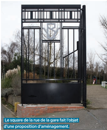
Le square de la rue de la gare fait l'objet d'une proposition d'aménagement.

TRENTE-ET-UN PROJETS RETENUS. Un skatepark, des bancs publics, un caniparc, un parcours mémoriel ou encore des ateliers de chant et de sécurité routière dans les écoles: voici quelques-uns des trente-et-un projets retenus parmi les 222 déposés par les Balbyniens. Des projets proposés entre février et avril derniers par les habitants lors de cafés participatifs organisés par le service démocratie locale de la Ville dans les bibliothèques, sur les marchés, à la gare routière, ainsi que sur le site internet jeparticipe.bobigny.fr . Ils ont donc été sélectionnés après analyse par les services municipaux qui en ont vérifié la légalité, la faisabilité technique et estimé leur coût. Ces idées d'aménagement de l'espace public ou de nouveaux services à la population concernent l'ensemble de la ville, ainsi que les quatre grands quartiers: centre-ville, Grand quadrilatère, Jean-Rostand/Abreuvoir, et les quartiers pavillonnaires.