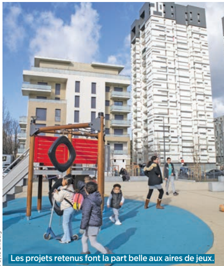
Les projets retenus font la part belle aux aires de jeux.

Après une phase d'appel à projets, le premier budget participatif de Bobigny dédié aux idées proposées par les habitants entre au stade de l'ultime sélection. À chaque Balbynien désormais de voter, du 24 septembre au 22 octobre, pour ses cinq coups de cœur parmi les trente-et-un projets retenus par la Ville.