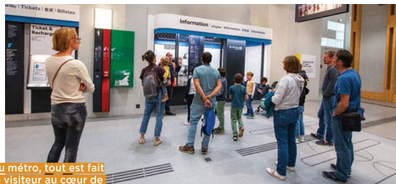
A la Fabrique du métro, tout est fait pour plonger le visiteur au cœur de l'aventure humaine et technique de la construction du nouveau métro.