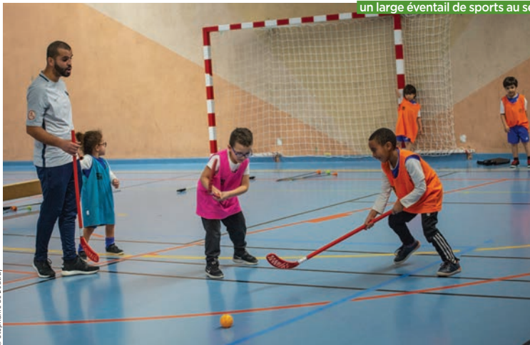
Enfants, ados, adultes et seniors : le service municipal des sports propose un large éventail de sports au sein de ses nombreuses installations.