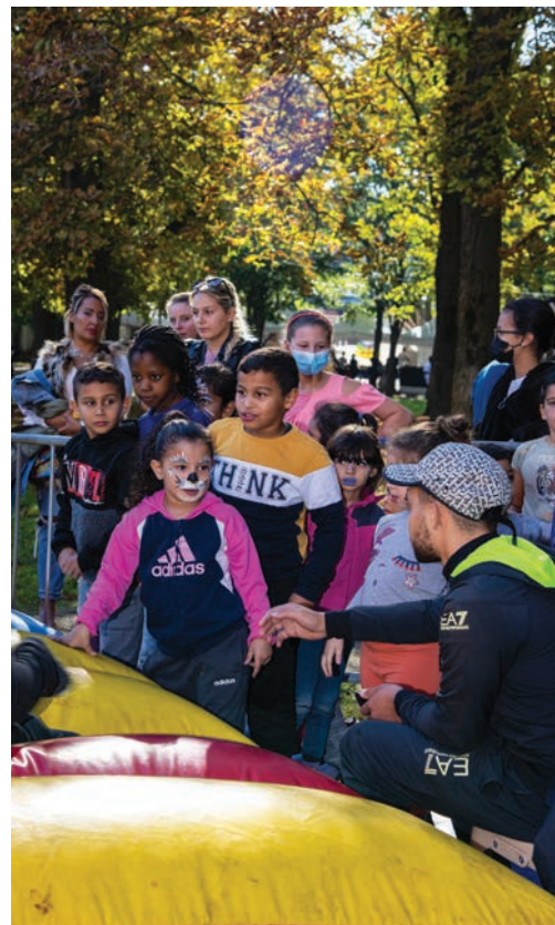
FÊTES DE QUARTIER