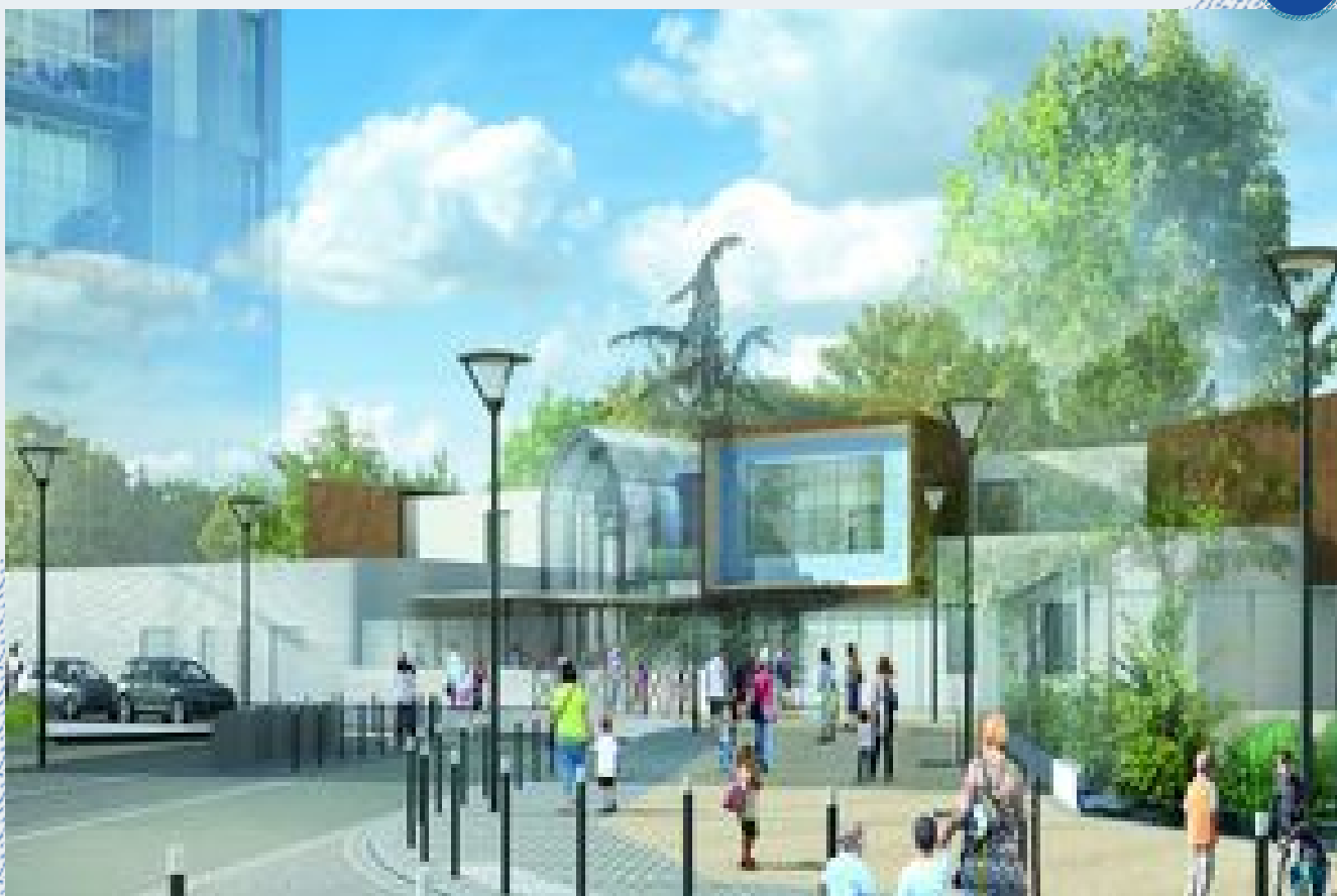
La nouvelle école Anne-Frank qui ouvrira au premier trimestre 2022