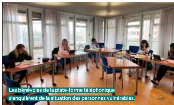
Les bénévoles de la plate-forme téléphonique s'enquêtent de la situation des personnes vulnérables.

★ Plate-forme dédiée au coronavirus : 01 41 60 97 30/31.