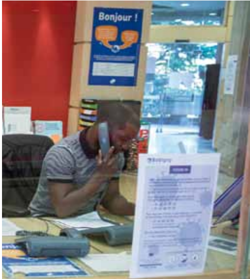
@Stéphanie de Boutray

Si l'hôtel de ville n'accueille plus de public depuis le début du confinement, de nombreux services, notamment le standard téléphonique, sont mobilisés pour aider et soutenir les Bobyniens.