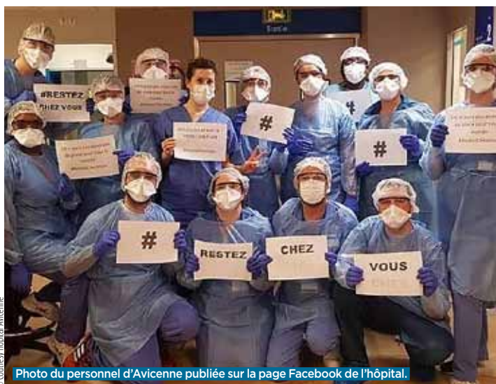
Photo du personnel d'Avicenne publiée sur la page Facebook de l'hôpital.