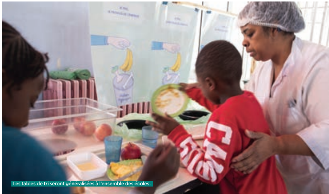
Les tables de tri seront généralisées à l'ensemble des écoles.

DEPUIS FÉVRIER 2019 , les élèves de quatre groupes scolaires* balbyniens trient les déchets alimentaires. En effet, des poubelles spécifiques installées dans les cantines scolaires leur permettent d'y glisser les restes alimentaires à la fin des repas. Ces biodéchets ne finiront plus à l'incinérateur, mais seront transformés en compost ou en énergie par la société Moulinot, une entreprise sociale et solidaire basée à Stains. Et l'expérience, appelée à être généralisée sur toute la ville, porte ses premiers fruits. Pas moins de 15,327 tonnes de déchets alimentaires ont été collectées entre février et août, soit une moyenne mensuelle de 2,19 tonnes. C'est le groupe scolaire Auguste-Delaune/Renée-Février qui arrive en tête avec 5,5 tonnes, suivi d'Édouard-Vaillant/