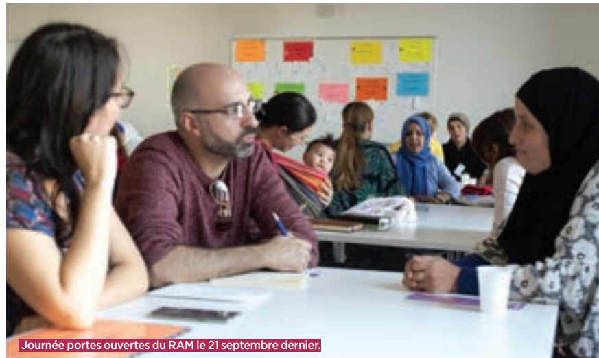
Journée portes ouvertes du RAM le 21 septembre dernier.

★ RAM – 26, rue de la Ferme, uniquement sur rendez-vous. Tél. : 01 75 34 30 19.