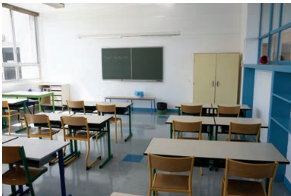
Peinture des espaces communs et des classes à l'école Auguste-Delaune