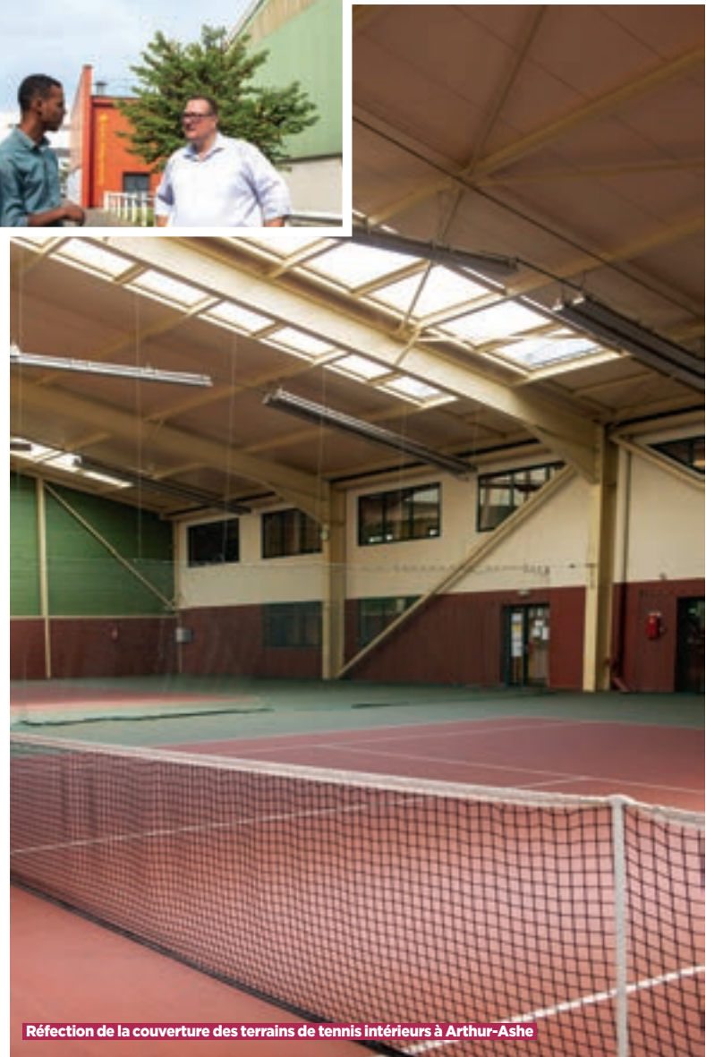
Réfection de la couverture des terrains de tennis intérieurs à Arthur-Ashe