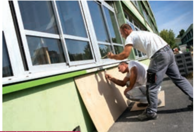
Transformation de préaux en salles de classe à Marcel-Cachin et Jean-Jaurès