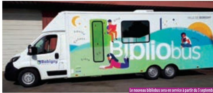
Le nouveau bibliobus sera en service à partir du 3 septembre.