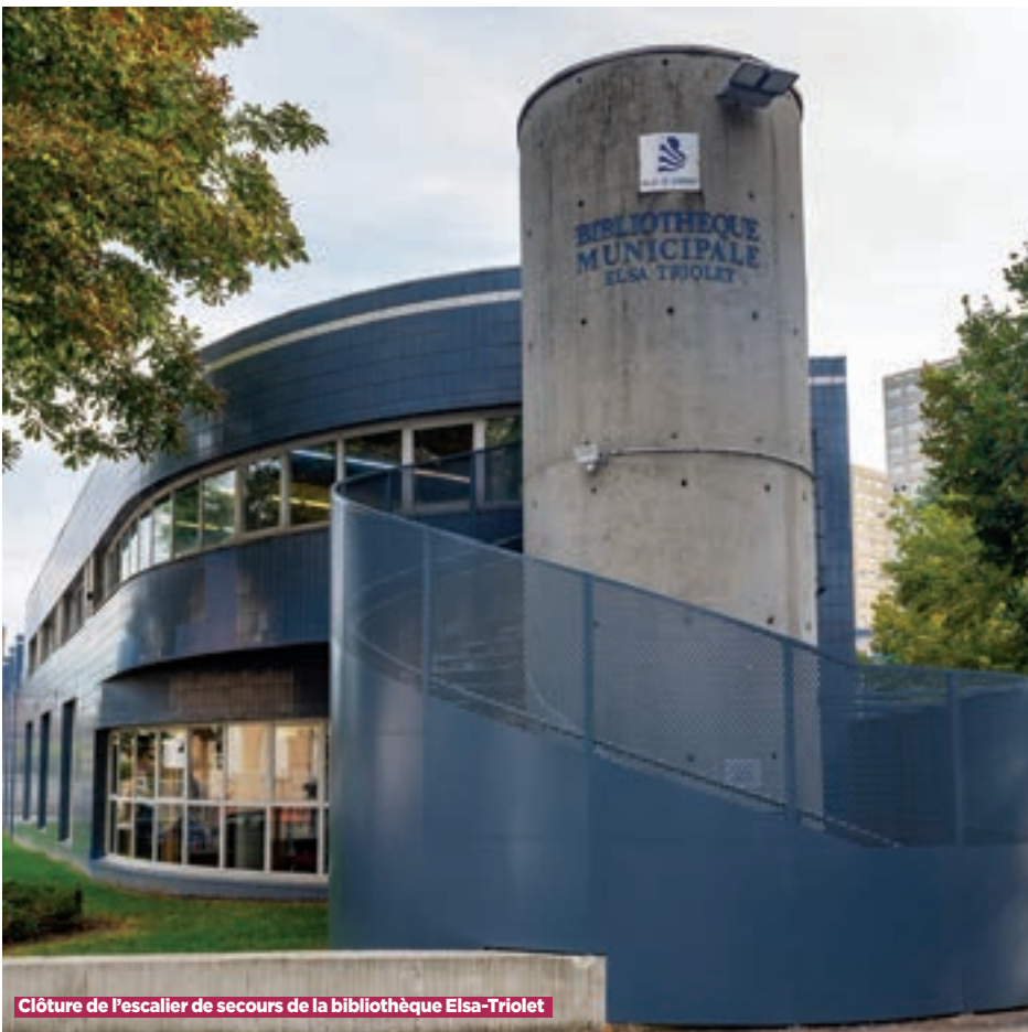
Clôture de l'escalier de secours de la bibliothèque Elsa-Triolet