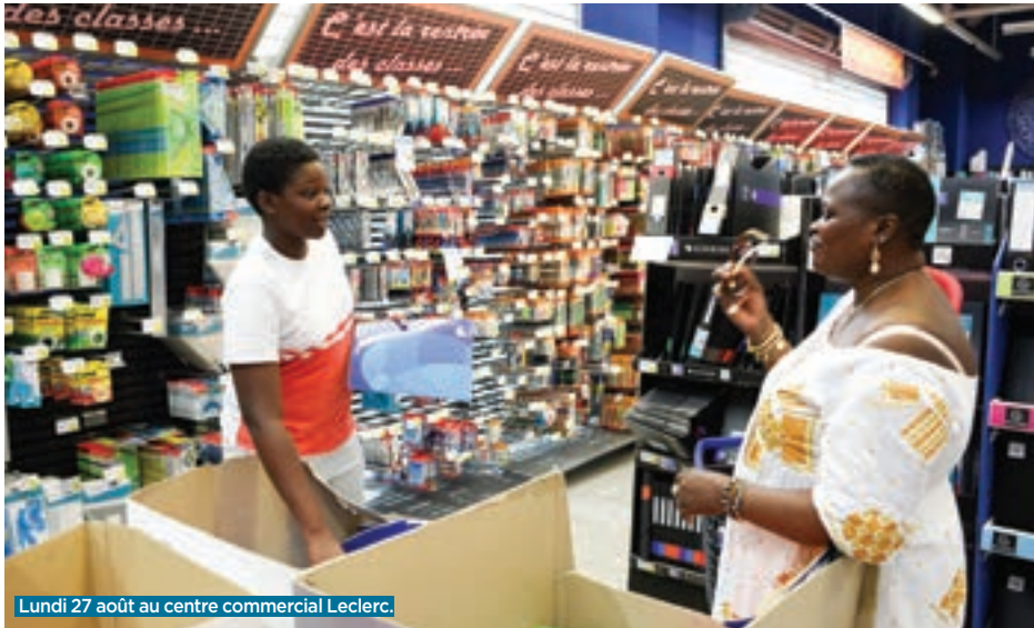
Lundi 27 août au centre commercial Leclerc.

Dans le quartier Auguste-Delaune, la rue Léo-Lagrange a fait peau neuve : le réseau d'assainissement a été rénové, l'éclairage public renouvelé, les réseaux électriques aériens enfouis, la chaussée refaite, les trottoirs élargis et des arbres plantés. Les riverains sont conviés à une cérémonie officielle de fin de chantier, en présence des élus, ce vendredi 30 août à 18 h. Fermeture de la rue à la circulation à partir de 15 heures.