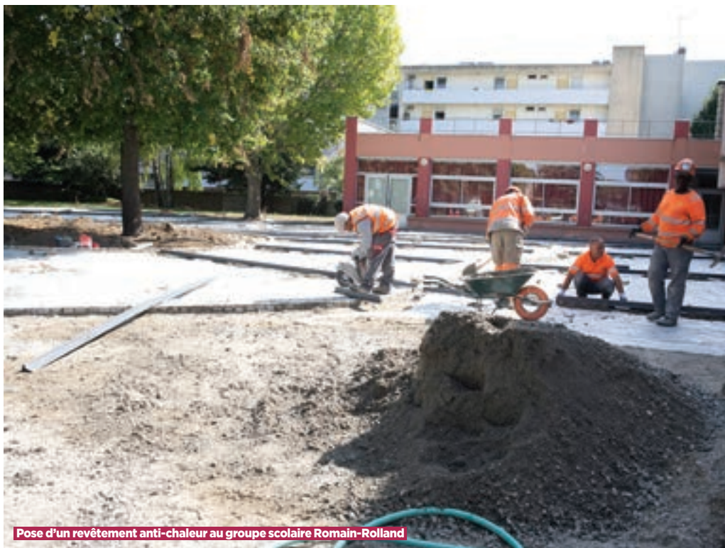
Pose d'un revêtement anti-chaleur au groupe scolaire Romain-Rolland