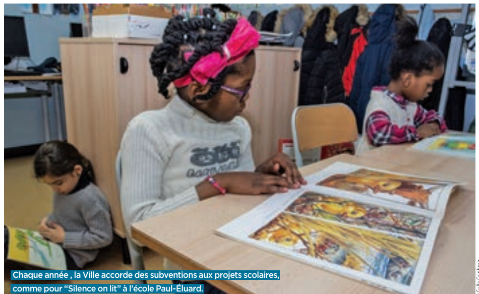
Chaque année, la Ville accorde des subventions aux projets scolaires, comme pour « Silence on lit » à l'école Paul-Éluard.