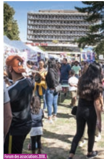
Forum des associations 2018.