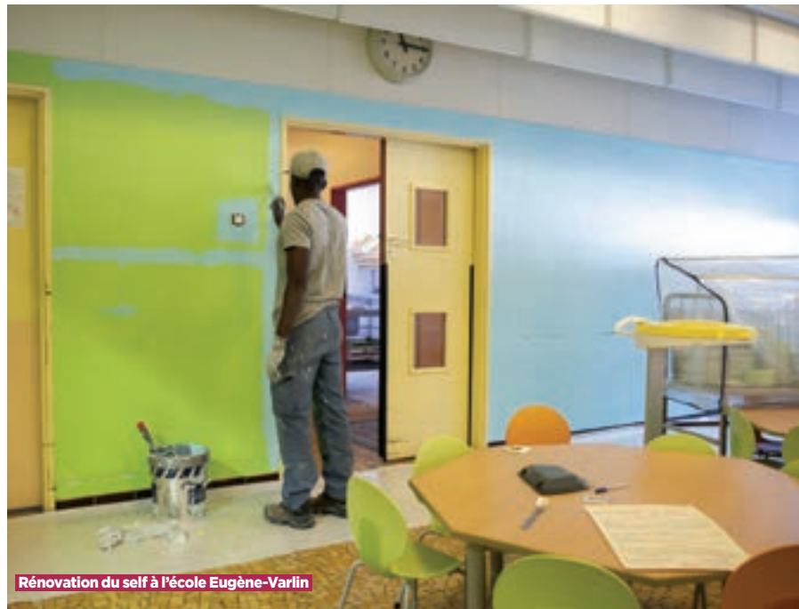
Rénovation du self à l'école Eugène-Varlin