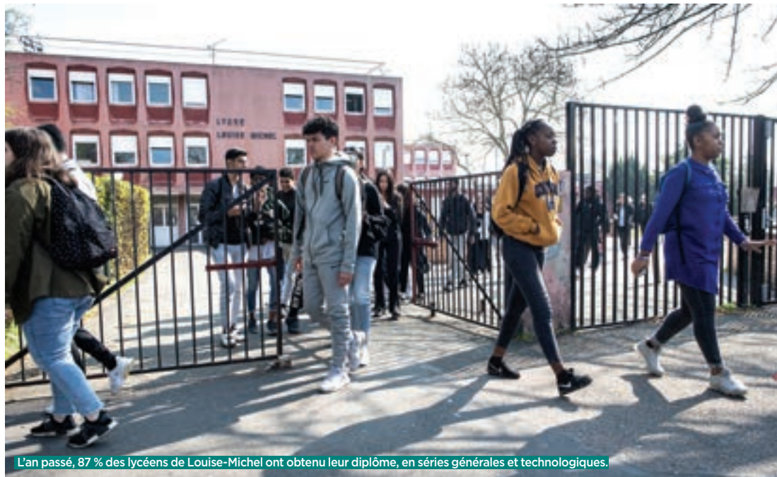
L'an passé, 87 % des lycéens de Louise-Michel ont obtenu leur diplôme, en séries générales et technologiques.