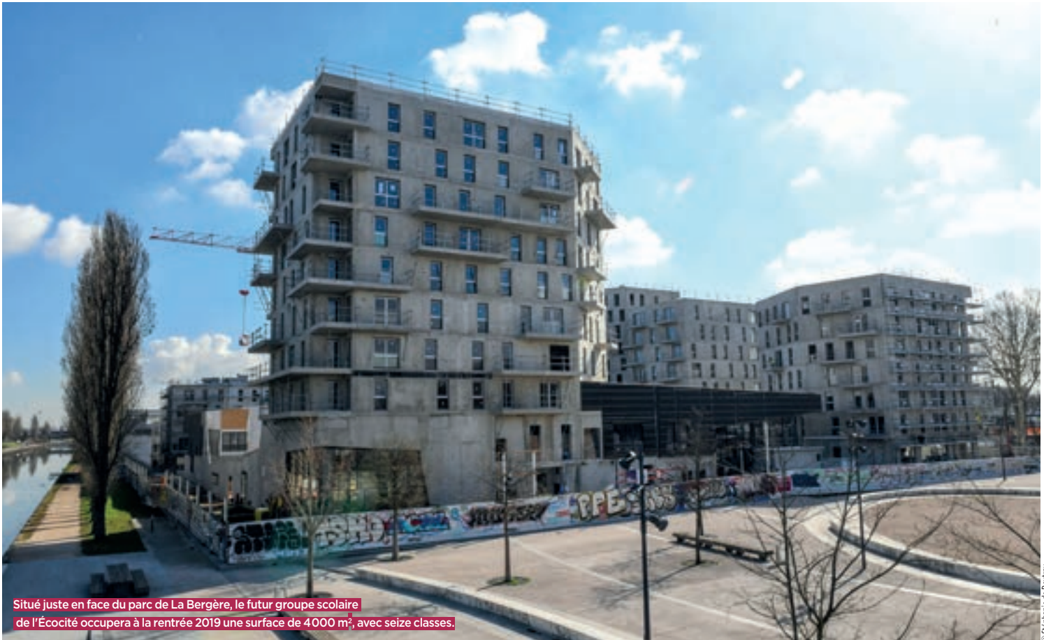
Situé juste en face du parc de La Bergère, le futur groupe scolaire de l'Écocité occupera à la rentrée 2019 une surface de 4 000 m 2 , avec seize classes.