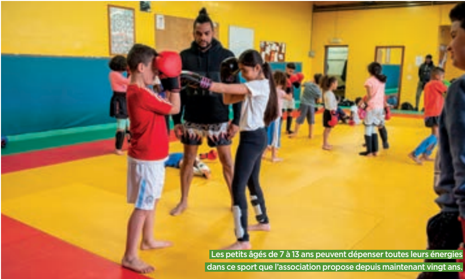
Les petits âgés de 7 à 13 ans peuvent dépenser toutes leurs énergies dans ce sport que l'association propose depuis maintenant vingt ans.