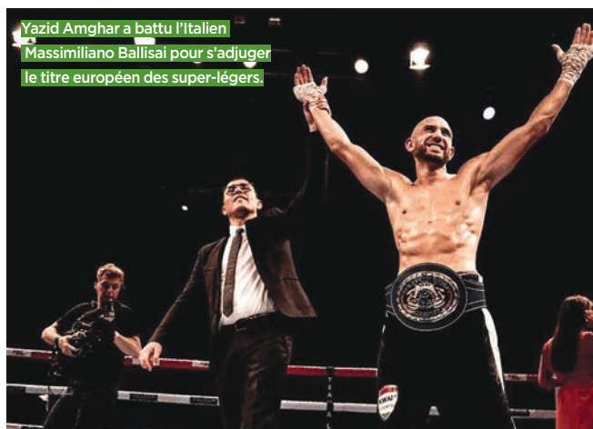
Yazid Amghar a battu l'Italien Massimiliano Ballisai pour s'adjuger le titre européen des super-légers.