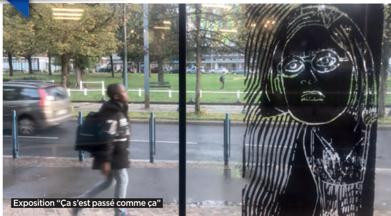
Exposition "Ca s'est passé comme ça"