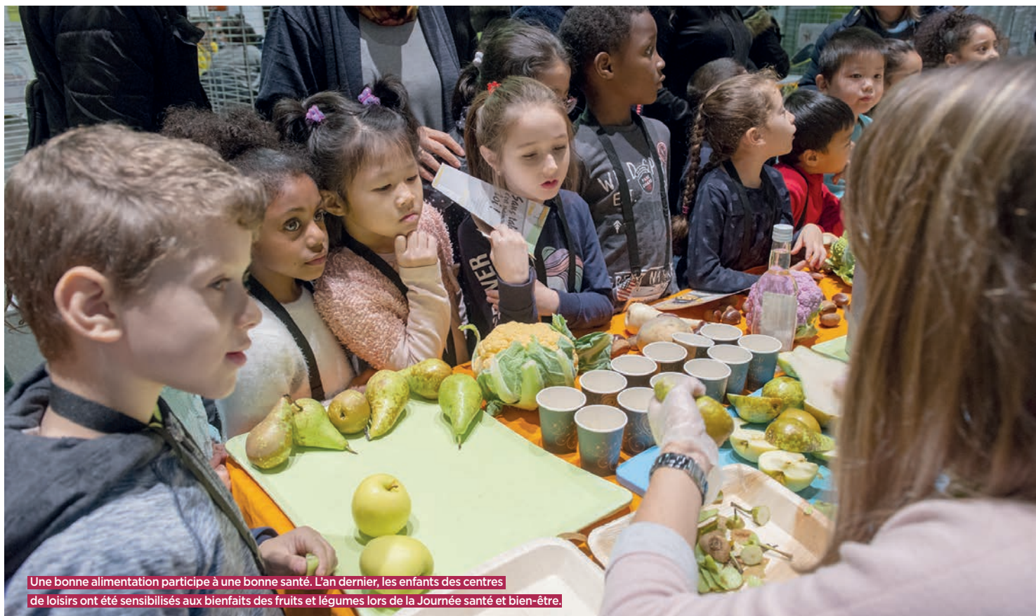
Une bonne alimentation participe à une bonne santé. L'an dernier, les enfants des centres de loisirs ont été sensibilisés aux bienfaits des fruits et légumes lors de la Journée santé et bien-être.