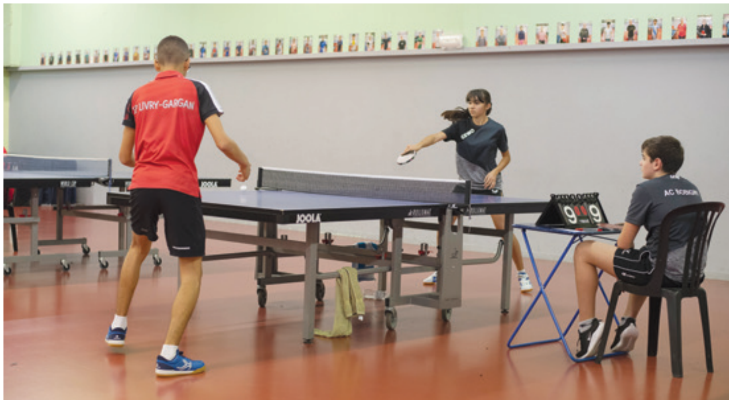
TENNIS DE TABLE