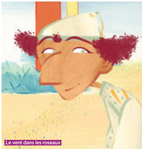
Le vent dans les roseaux

Jusqu'au 31 octobre, petits et grands peuvent découvrir des expositions, des projections et des ateliers autour de films d'animation de qualité.