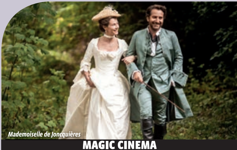
Mademoiselle de Jonquières