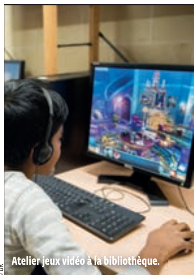
Atelier jeux vidéo à la bibliothèque.