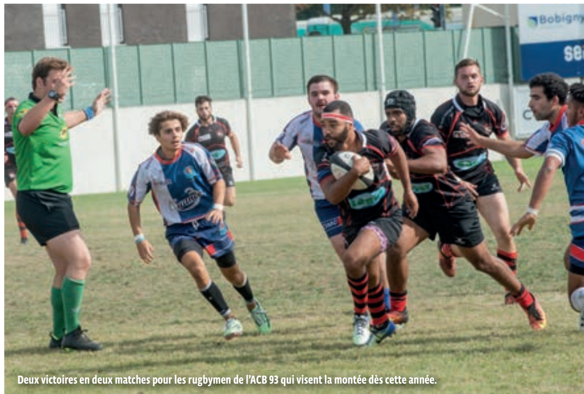
Deux victoires en deux matches pour les rugbymen de l'ACB 93 qui visent la montée dès cette année.

RUGBY Rétrogradé pour raisons financières en division inférieure pour la seconde année consécutive, l'ACB 93 redémarre en Fédérale 3 avec une nouvelle équipe dirigeante et de jeunes joueurs prêts à redorer le blason du club.