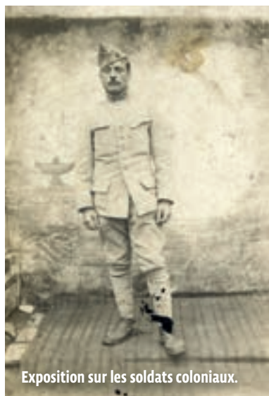
Exposition sur les soldats coloniaux.