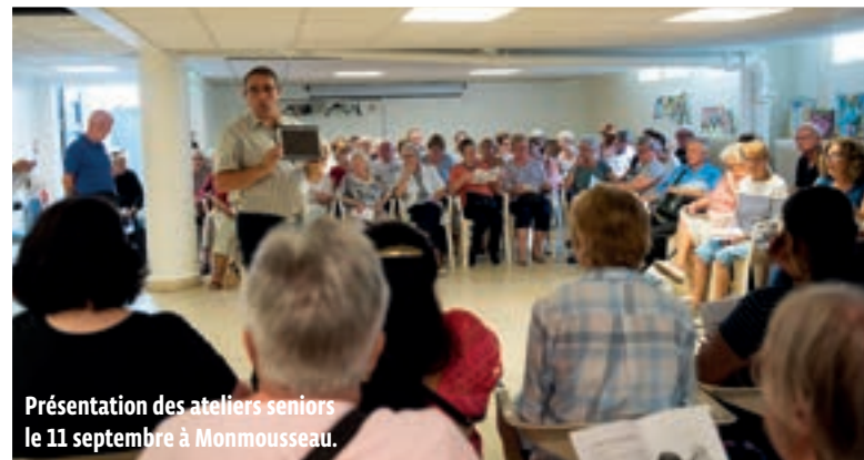
Présentation des ateliers seniors le 11 septembre à Monmousseau.