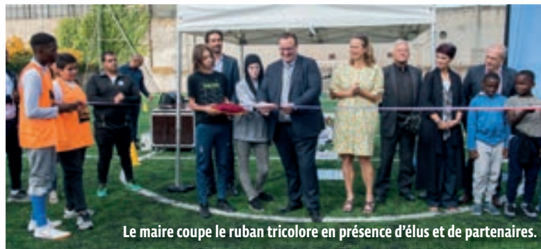
Le maire coupe le ruban tricolore en présence d'élus et de partenaires.