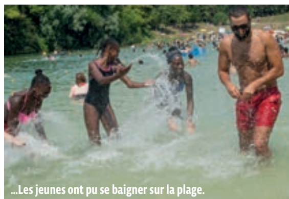
...Les jeunes ont pu se baigner sur la plage.