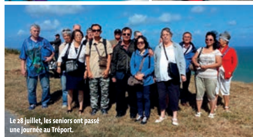
Le 28 juillet, les seniors ont passé une journée au Tréport.