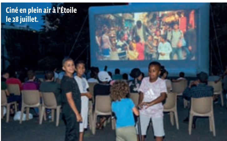
Ciné en plein air à l'Étoile le 28 juillet.