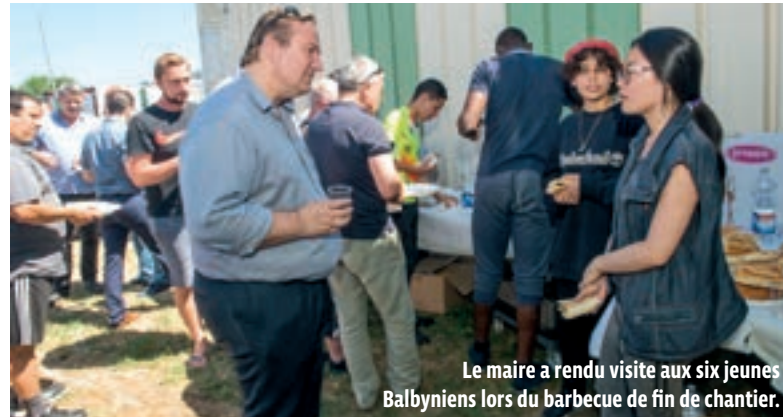
Le maire a rendu visite aux six jeunes Balbyniens lors du barbecue de fin de chantier.