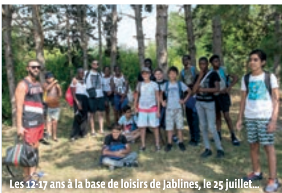
Les 12-17 ans à la base de loisirs de Jablines, le 25 juillet...