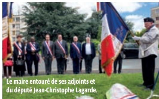
Le maire entouré de ses adjoints et du député Jean-Christophe Lagarde.