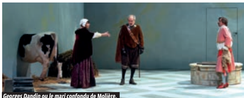
Georges Dandin ou le mari confondu de Molière.