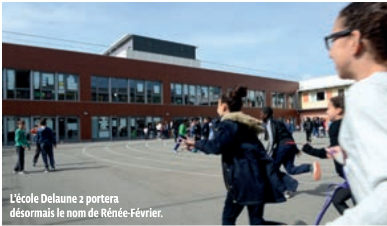
L'école Delaune 2 portera désormais le nom de Renée-Février.