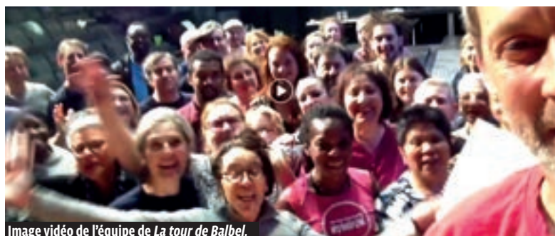
Image vidéo de l'équipe de La tour de Balbel .