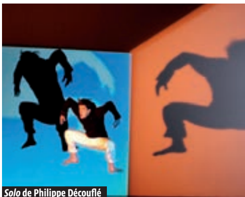
Solo de Philippe Découfflé

à Paris, le metteur en scène présentera nombre de ses pièces à la MC 93 en plus du théâtre de l'Odéon. Ses représentations seront entrecoupées par un « Banquet capital », auquel chacun peut assister gratuitement pourvu qu'il vienne avec quelque chose à manger. Une performance théâtrale à l'image des banquets républicains de 1848.