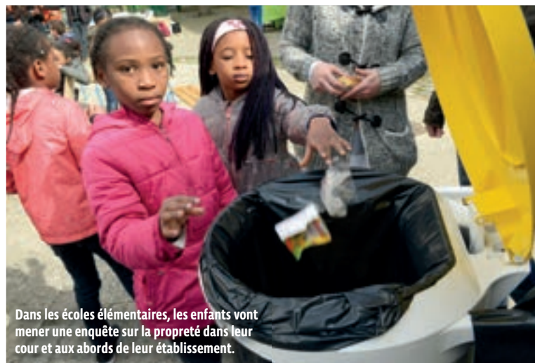
Dans les écoles élémentaires, les enfants vont mener une enquête sur la propreté dans leur cour et aux abords de leur établissement.

À Bobigny, pour la SEDD, les élus ont défini comme fil rouge, pour cette édition 2018, la sensibilisation des enfants. Une animation sera ainsi proposée dans chaque école et chaque centre de loisirs de la ville. En ce qui concerne les écoles maternelles et les centres de loisirs maternelles, deux défis, adaptés à leur âge, seront proposés. Le premier a trait au jardinage : les écoles maternelles ayant une convention de jardins pédagogiques avec la Ville vont ainsi recevoir un plant de petit légume (tomate cerise) et une plante mellifère (bourrache). Les enfants devront les planter et les faire grandir pour observer la croissance des légumes et la venue d'insectes sur le jardin. Il leur sera ensuite demandé de rendre un travail d'observation sur leur jardin. Cerise sur le gâteau : les jardiniers les plus investis seront récompensés. Ils recevront des kits