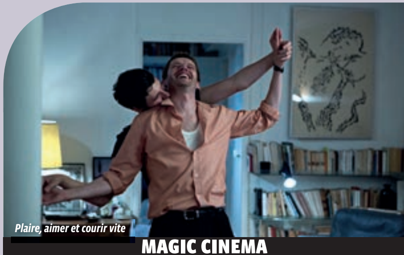
Plaire, aimer et courir vite