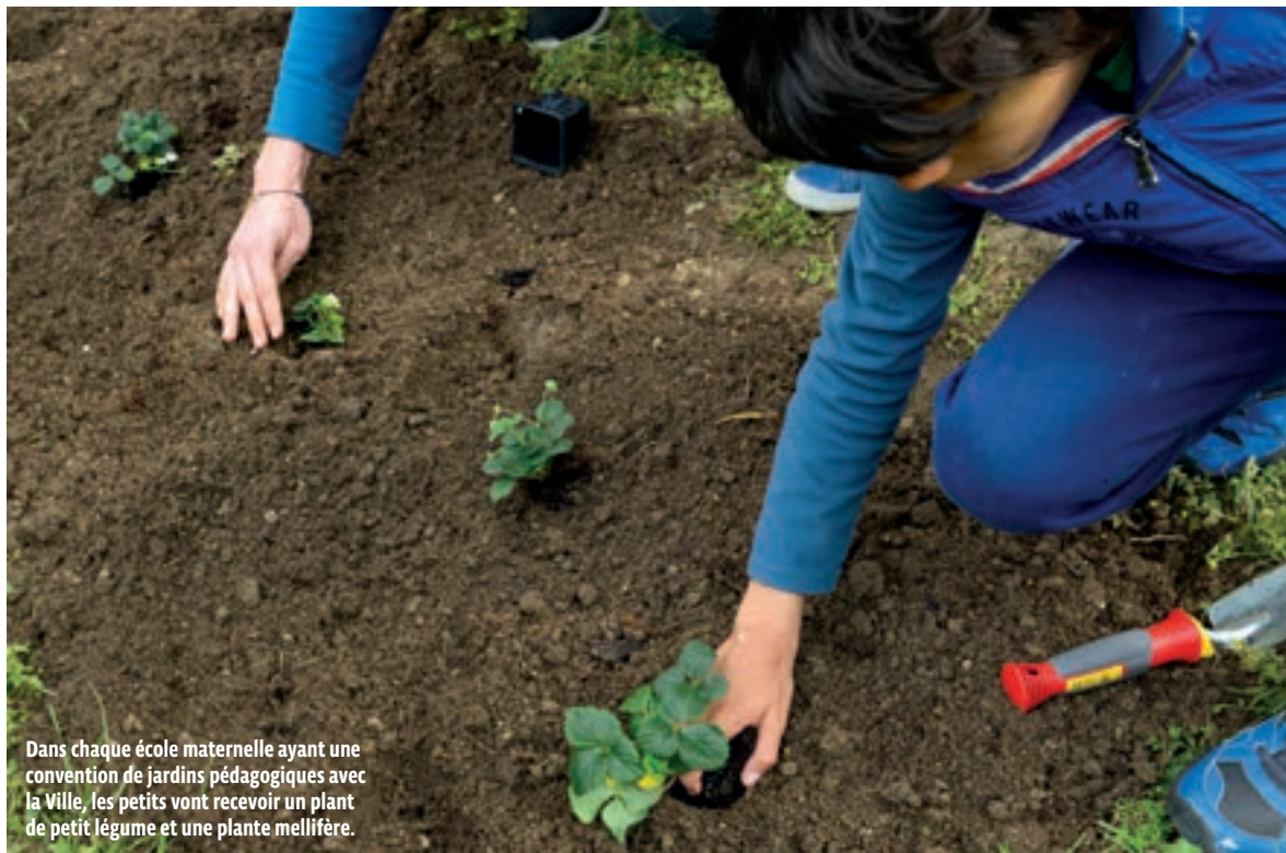
Dans chaque école maternelle ayant une convention de jardins pédagogiques avec la Ville, les petits vont recevoir un plant de petit légume et une plante mellifère.

ENVIRONNEMENT Bobigny va vivre au rythme de la Semaine européenne du développement durable du 30 mai au 5 juin . De nombreuses animations pour petits et grands seront proposées autour de la sensibilisation à la transition écologique, afin de faire évoluer les comportements de chacun.