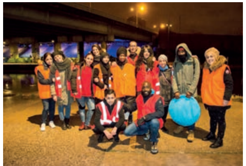
Les membres d'Étincelle d'espoir effectuent des maraudes tous les deux jours, parfois avec l'aide d'autres associations, comme Ados ce soir-là.