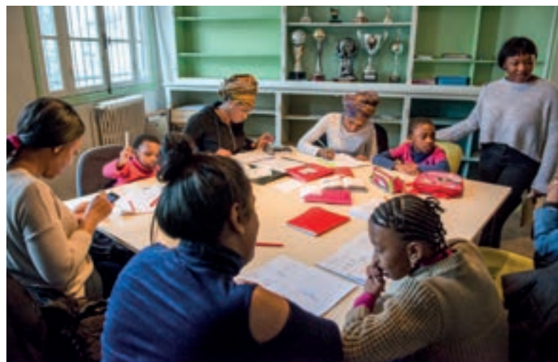
Soutien scolaire avec Les mamans de Bobigny.