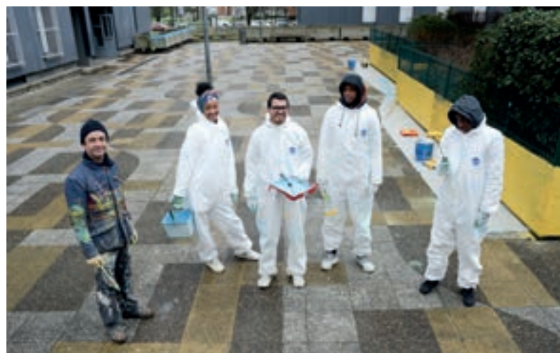
Chantier éducatif avec l'association Mejless à Paul-Éluard.

« La philanthropie n'a pas de limites. » Tel est le slogan d'APO-G. L'association se démène sans compter pour dynamiser le quartier de l'Abreuvoir et offrir des activités aux plus jeunes, comme ce jour-là avec une initiation-découverte de la boxe sur le stand du Boxing Bobigny 93.