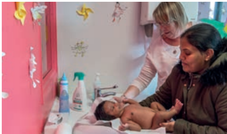
Une offre diversifiée de soins au Centre polyvalent de santé Aimé-Césaire.