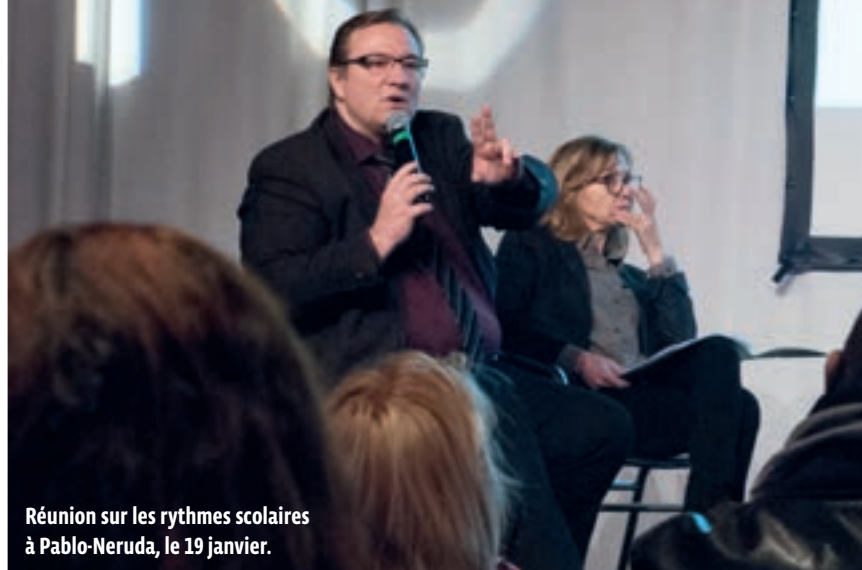
Réunion sur les rythmes scolaires à Pablo-Neruda, le 19 janvier.

ÉDUCATION La Ville a présenté, la semaine dernière lors de réunions d'information, ses deux scénarios sur la réforme des rythmes scolaires. Les parents ont jusqu'à demain 26 janvier pour se prononcer.