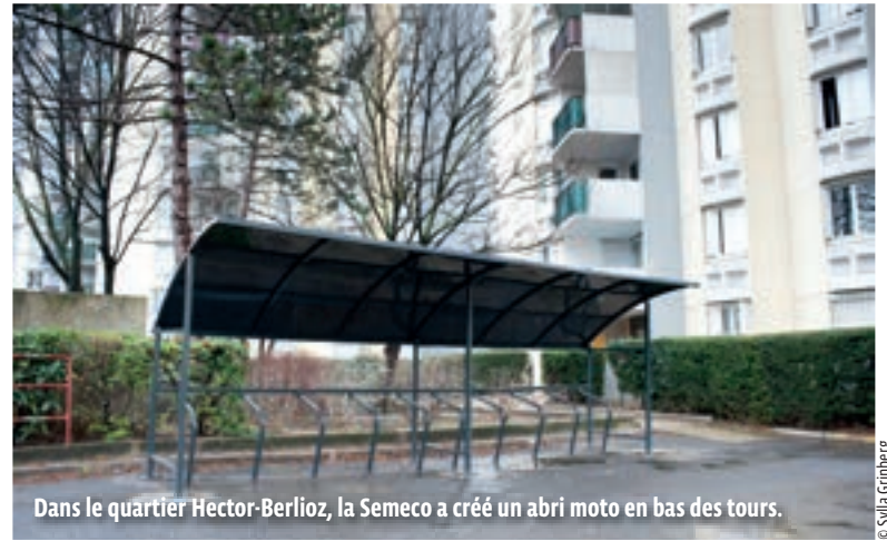
Dans le quartier Hector-Berlioz, la Semeco a créé un abri moto en bas des tours.

CADRE DE VIE Avec la sécurisation des parkings et un projet de jardins partagés, la Semeco met les bouchées doubles pour améliorer le quotidien des habitants.