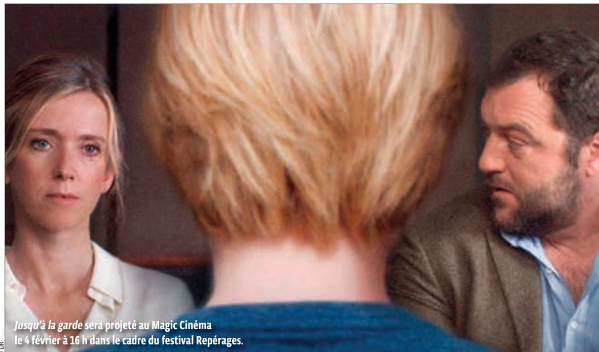
Jusqu'à la garde sera projeté au Magic Cinéma le 4 février à 16 h dans le cadre du festival Repérages.

7 E ART Est ensemble lance un festival de cinéma dédié aux premières œuvres. Sept films en compétition autour de la jeunesse seront projetés dans sept cinémas, dont celui de Bobigny le 4 février. Avec Reda Kateb en parrain !