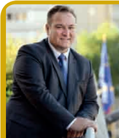
LE MAIRE VOUS REÇOIT

■ Lundis 14 et 21 août pour les cités Chemin Vert, Karl Marx, Paul Eluard et Hector Berlioz.