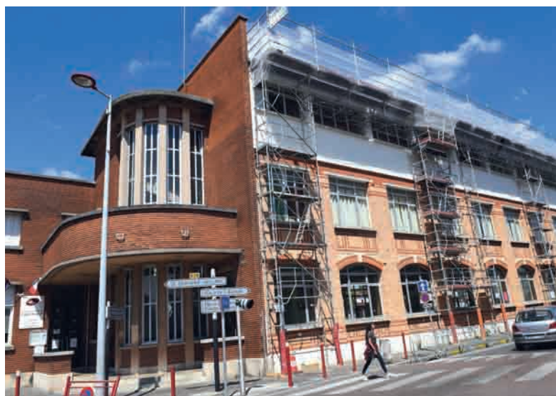
D'importantes opérations de réfection de toiture sont menées actuellement dans les écoles, comme ici à Eugène-Varlin.

La première phase de déploiement de la vidéo-protection va s'achever mi-juillet. Cette première étape comprend 18 caméras reliées au centre de supervision urbain (CSU). La seconde phase débutera en septembre pour s'achever au premier semestre 2018 et comprendra 33 nouvelles caméras. Coût de la première phase : 1,2 million d'euros.