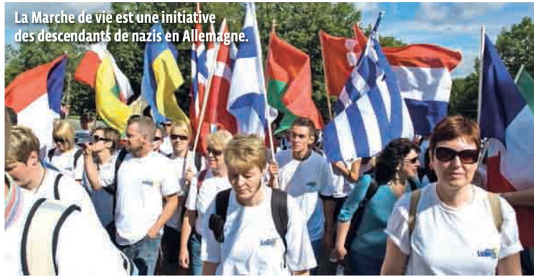
La Marche de vie est une initiative des descendants de nazis en Allemagne.