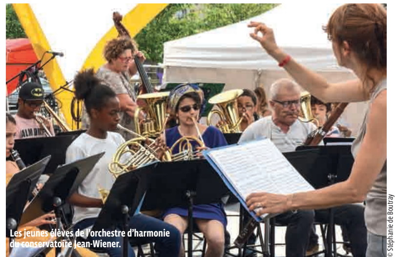
Les jeunes élèves de l'orchestre d'harmonie du conservatoire Jean-Wiener.