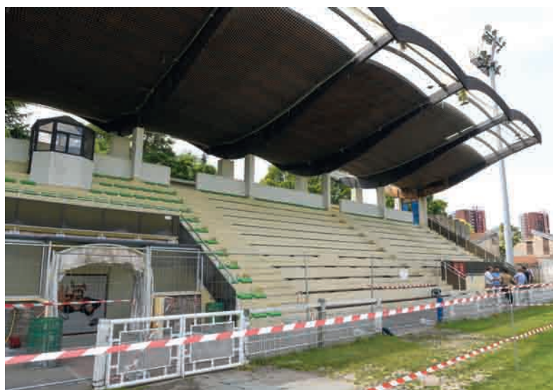
La toiture de la tribune du stade Wallon est en cours de réfection pour un investissement global de 275 000 € TTC.