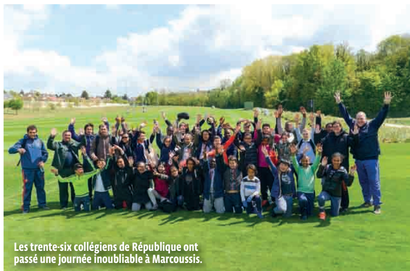
Les trente-six collégiens de République ont passé une journée inoubliable à Marcoussis.