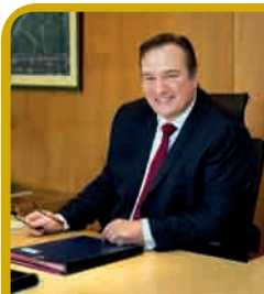
LE MAIRE VOUS REÇOIT

■ Lundi 8 mai pour les cités Pablo-Picasso, Les Sablons, Paul-Vaillant-Couturier et Étoile.