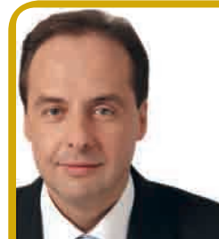
LE DÉPUTÉ VOUS REÇOIT

■ Vendredi : céleri rémoulade, saucisse de porc ou poisson, lentilles, coulommiers, gélifié au caramel.