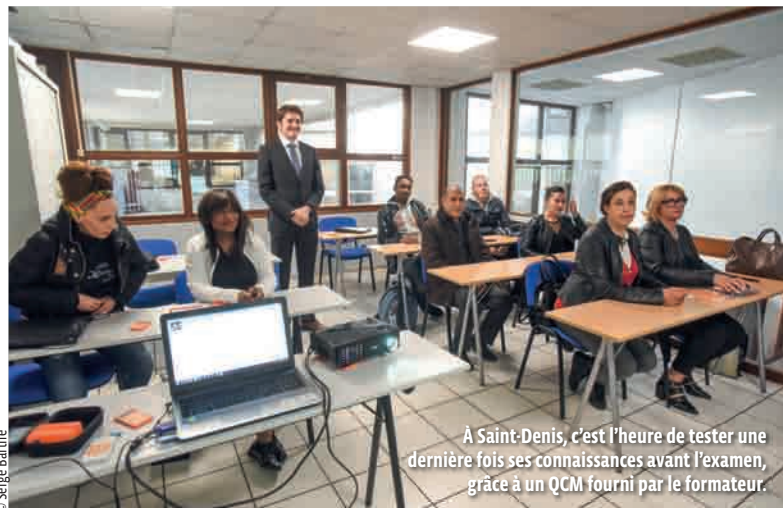
À Saint-Denis, c'est l'heure de tester une dernière fois ses connaissances avant l'examen, grâce à un QCM fourni par le formateur.

INSERTION Grâce à un partenariat entre le projet de ville-RSA, le Département et le Medef, dix Balbyniens allocataires du RSA ont suivi pendant un mois une formation qualifiante dans le domaine des métiers de la sécurité. Explications.