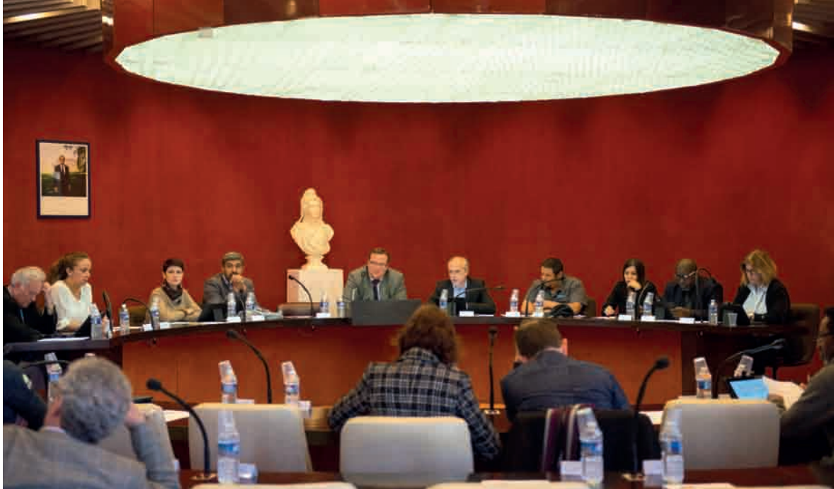
Trois mémoires ont concerné la rénovation du quartier Karl-Marx.

CONSEIL MUNICIPAL Quatre délibérations sur le devenir du centre-ville ont notamment été votées avant la signature de la promesse de vente du centre commercial Bobigny 2 à Altarea Cogedim.