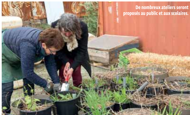
De nombreux ateliers seront proposés au public et aux scolaires.