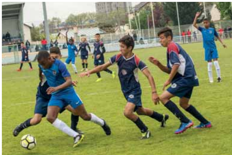
L'AFB a chuté en demi-finale contre Bordeaux et se classe à une très belle 4 e place.