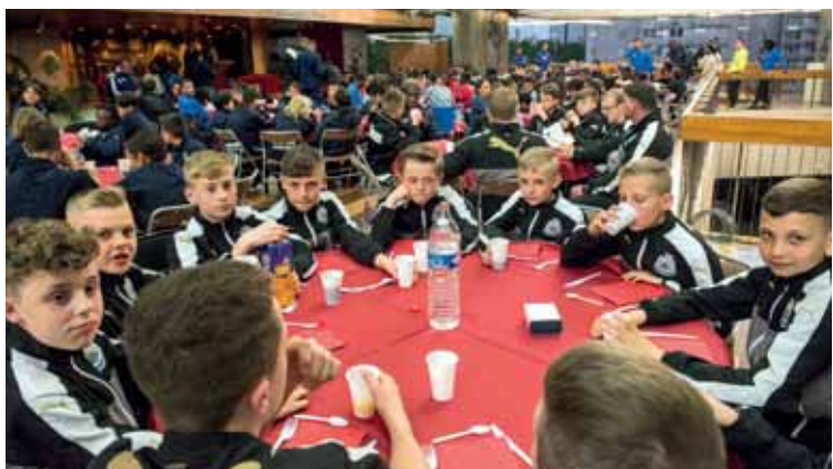
La Ville a offert le samedi soir un grand repas de bienvenue aux 16 équipes participantes.