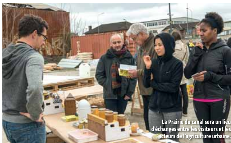
La Prairie du canal sera un lieu d'échanges entre les visiteurs et les acteurs de l'agriculture urbaine.