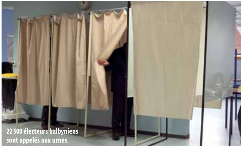
22 500 électeurs balbyniens sont appelés aux urnes.

VIE CITOYENNE Le premier tour de l'élection présidentielle aura lieu ce dimanche 23 avril, suivi du deuxième tour le 7 mai. Un scrutin qui précède les législatives des 11 et 18 juin prochains.