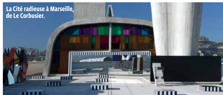
La Cité radieuse à Marseille, de Le Corbusier.