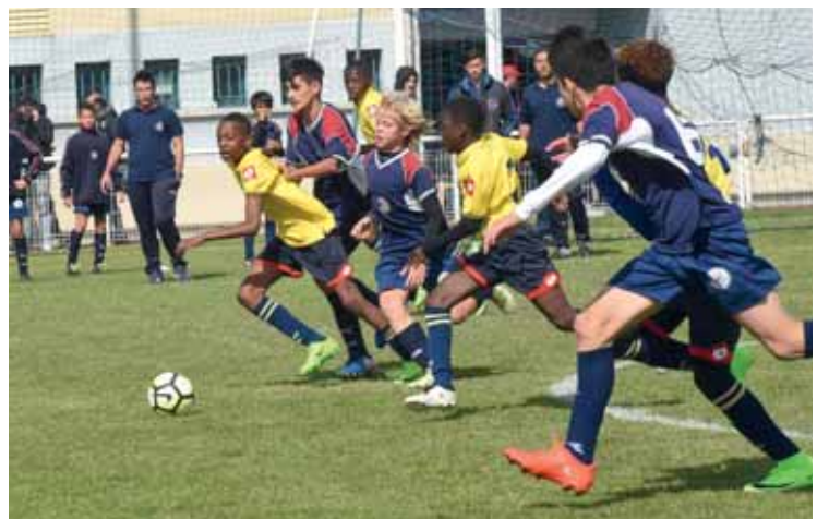
Les Argentins du Proyecto Crecer ont régalé avec leur technique.