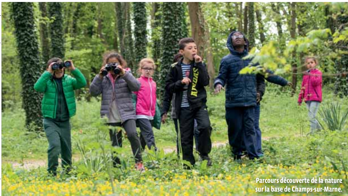
Parcours découverte de la nature sur la base de Champs-sur-Marne.