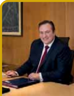
LE MAIRE VOUS REÇOIT