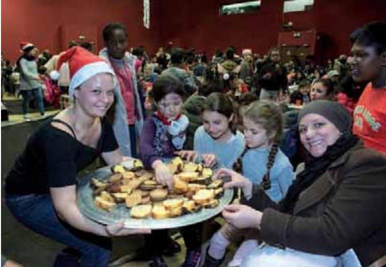
Le Noël des Femmes Relais