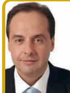
LE DÉPUTÉ VOUS REÇOIT

Le CCAS organise un transport pour les retraités désirant se rendre au cimetière intercommunal de La Courneuve le premier mercredi de chaque mois. Prochain rendez-vous le mercredi 4 janvier . Rendez-vous : angle rue Gallieni/Victor-Hugo à 14 h 30, Passerelle à 14 h 35, Étoile à 14 h 50, Jean-Racine