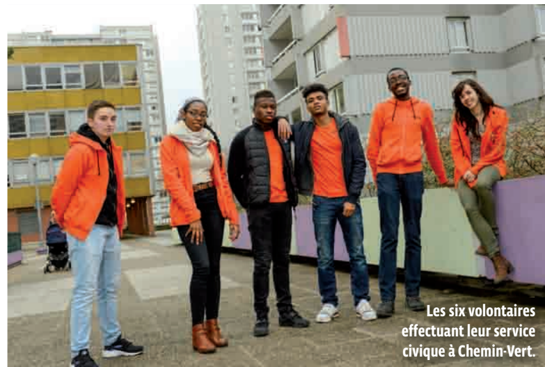
Les six volontaires effectuant leur service civique à Chemin-Vert.

ENVIRONNEMENT Les six volontaires en service civique d'Unis-cité organisent de nombreuses animations pour sensibiliser les Balbyniens aux écocitoyens.