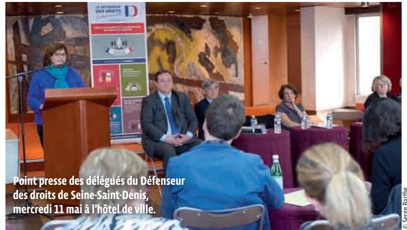
Point presse des délégués du Défenseur des droits de Seine-Saint-Denis, mercredi 11 mai à l'hôtel de ville.

→ 25, rue Miriam-Makeba. Du lun. au jeu. de 11 h à 23 h; ven. et sam. de 11 h à minuit.