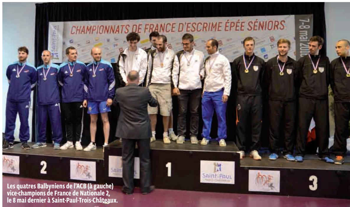
Les quatre Balbyniens de l'ACB (à gauche) vice-champions de France de Nationale 2, le 8 mai dernier à Saint-Paul-Trois-Châteaux.