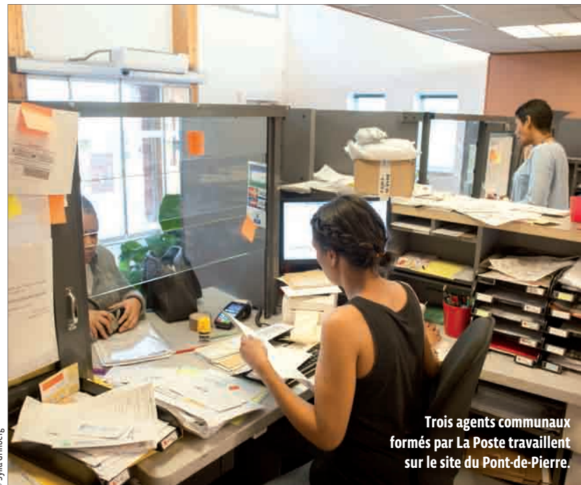
Trois agents communaux formés par La Poste travaillent sur le site du Pont-de-Pierre.