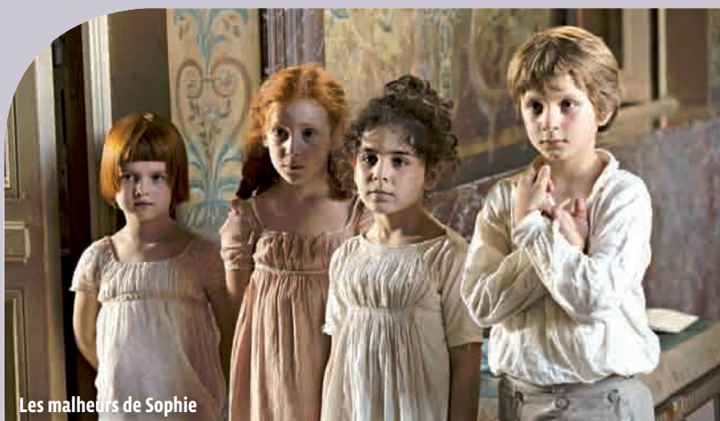
Les malheurs de Sophie