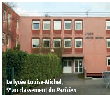
Le lycée Louise-Michel, 5 e au classement du Parisien .

SYNERGIE. Outre le palmarès du quotidien régional, le magazine L'Express a lui aussi publié le sien, fondé sur la moyenne obtenue entre le taux de réussite au bac, la capacité de l'établissement à faire progresser ses élèves et l'indice de stabilité. Ce classement octroie à Louise-Michel la note de 16,2/20 et une 258 e place sur 2 277 établissements publics et privés étudiés. Une place plus qu'honorable quand on sait que 195 lycées - dont 22 du public - ont affiché 100 % de réussite au bac en 2015 alors que seuls 87 % des candidats avaient ob-