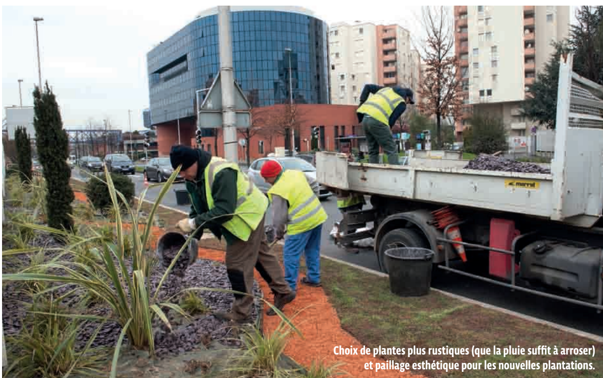
Choix de plantes plus rustiques (que la pluie suffit à arroser) et paillage esthétique pour les nouvelles plantations.

ENVIRONNEMENT Loi de transition énergétique oblige, la Ville a adopté une démarche de gestion en développement durable de ses espaces verts. Des méthodes de travail innovantes et responsables qui ont aussi le mérite de coûter moins cher à la municipalité.