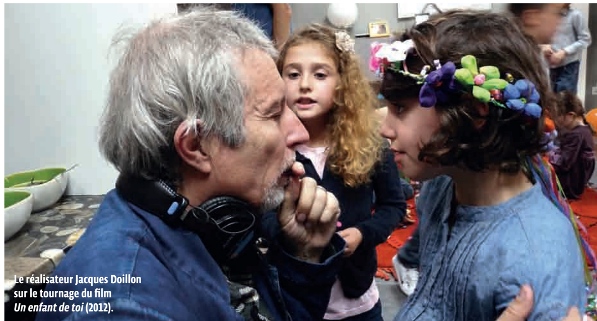
Le réalisateur Jacques Doillon sur le tournage du film Un enfant de toi (2012).