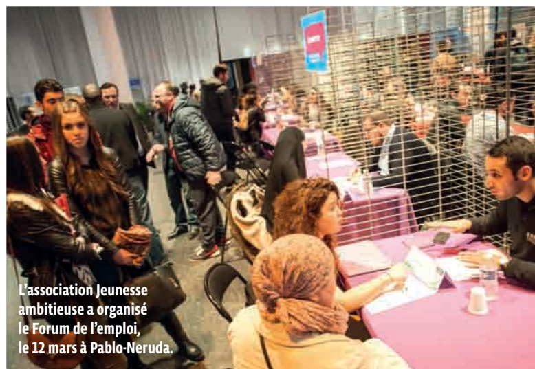
L'association Jeunesse ambitieuse a organisé le Forum de l'emploi, le 12 mars à Pablo-Neruda.

RÉUSSITE Un mois après avoir organisé son premier Forum de l'emploi et l'orientation, en partenariat avec Prémices, l'association Jeunesse ambitieuse proposera, du 18 au 29 avril, des stages intensifs pendant les vacances scolaires pour les élèves de 3 e et de terminale.