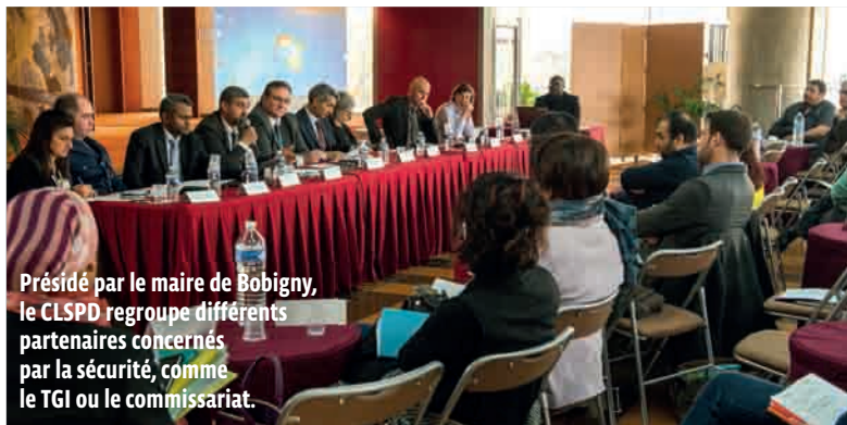
Présidé par le maire de Bobigny, le CLSPD regroupe différents partenaires concernés par la sécurité, comme le TGI ou le commissariat.

TRANQUILLITÉ PUBLIQUE La municipalité a lancé son Conseil local de sécurité et de prévention de la délinquance (CLSPD), mardi 22 mars. Son but : associer les acteurs du territoire pour mieux appréhender les phénomènes d'insécurité.