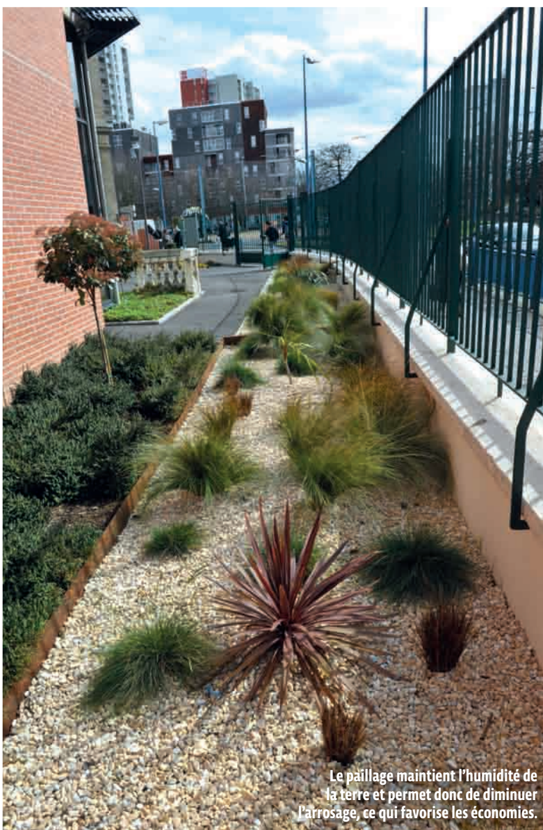
Le paillage maintient l'humidité de la terre et permet donc de diminuer l'arrosage, ce qui favorise les économies.