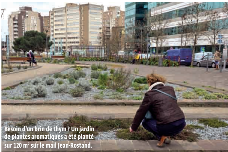
Besoin d'un brin de thym ? Un jardin de plantes aromatiques a été planté sur 120 m 2 sur le mail Jean-Rostand.