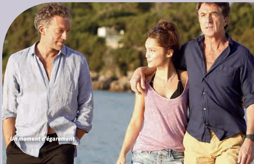
Un moment d'égarément