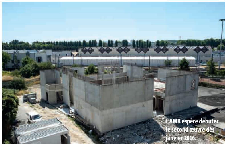
L'AMB espère débiter le second œuvre dès janvier 2016.

CULTE Le lieu pourrait ouvrir ses portes fin 2016, espère l'association des musulmans de Bobigny.