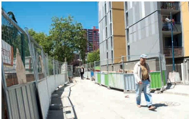
La rue Anne-Frank va être prochainement réalisée.

KARL-MARX Une nouvelle page se tourne avec la démolition de l'ancien bâtiment de la CPAM à partir du 20 juillet puis celui de la double tour 36-38 en septembre.