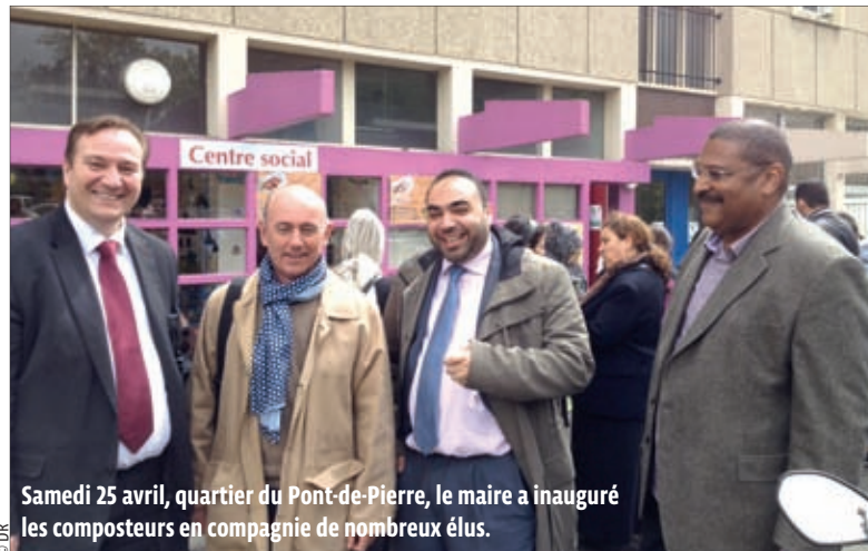
Samedi 25 avril, quartier du Pont-de-Pierre, le maire a inauguré les composteurs en compagnie de nombreux élus.

la Ville, qui « nous a trouvé ce terrain » derrière le gymnase Henri-Wallon.