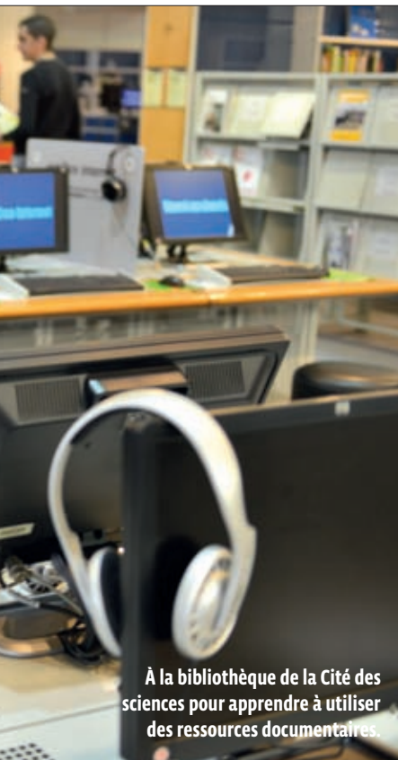
À la bibliothèque de la Cité des sciences pour apprendre à utiliser des ressources documentaires.