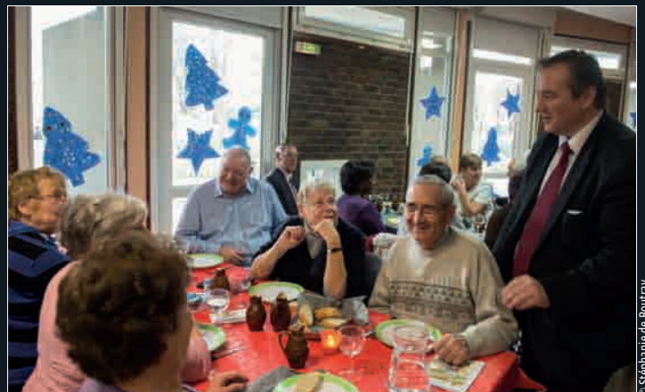
Seniors. Un repas de Noël était organisé dans les foyers de retraités, jeudi 18 décembre. Accompagné de son adjointe au 3 e âge, le maire s'est successivement rendu à Ambroise-Croizat, Pierre-Sémard et Gaston-Monmousseau.