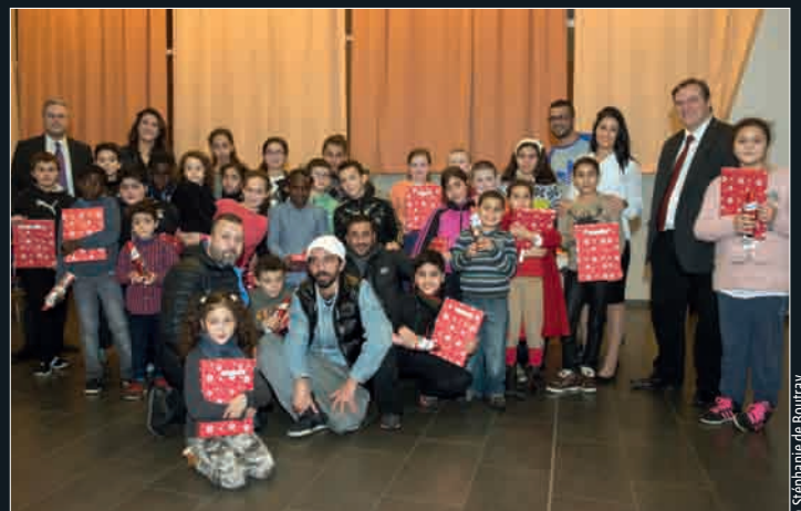
Fête. C'est dans les locaux du campus des métiers, où elle a l'habitude d'assurer son aide aux devoirs, que l'association Kyerozen a convié, vendredi 19 décembre, ses "élèves" à une fête de Noël agrémentée d'une distribution de cadeaux en présence du maire.