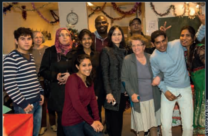
Amitié. Les personnes fréquentant les cours d'apprentissage du français de l'association Les Petits jardiniers de l'Amitié ont festoyé, jeudi 18 décembre, à l'occasion des réjouissances organisées par les bénévoles.