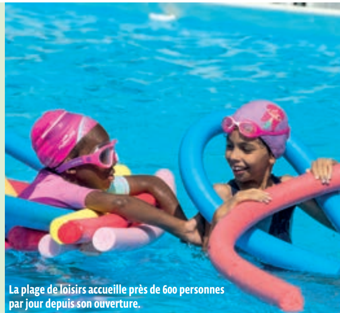
La plage de loisirs accueille près de 600 personnes par jour depuis son ouverture.

Le maire a donné le coup d'envoi de la plage de loisirs en compagnie de plusieurs adjoints.