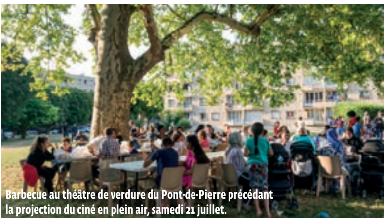
Barbecue au théâtre de verdure du Pont-de-Pierre précédant la projection du ciné en plein air, samedi 21 juillet.