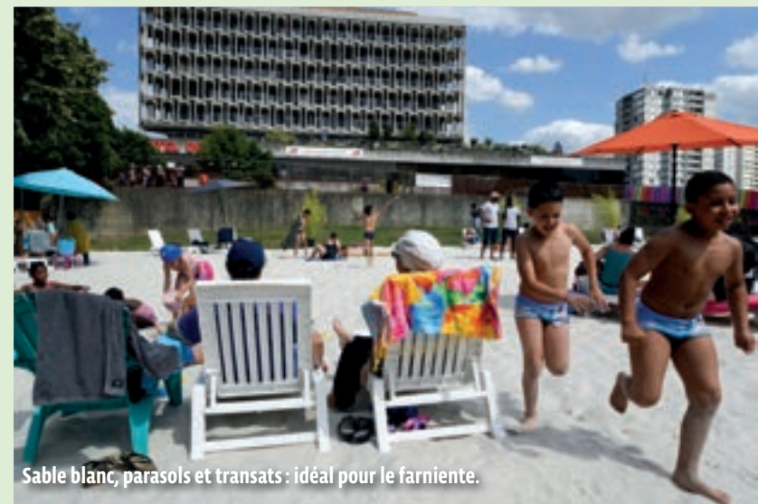
Sable blanc, parasols et transats : idéal pour le farniente.