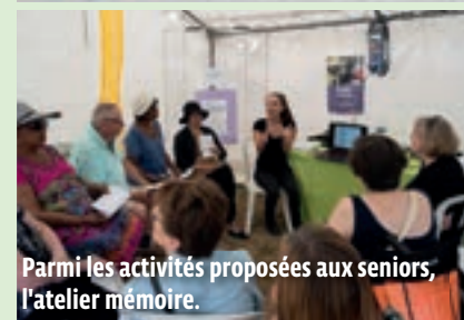
Parmi les activités proposées aux seniors, l'atelier mémoire.